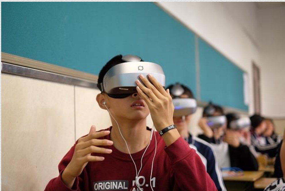
十几岁的中学生们对这种新颖的教学方式很兴奋

在此之前的11月，谷歌CEO桑达尔·皮查伊（Sundar Pichai）第一次到访英国，就表示要通过教育项目Expeditions，给英国学生提供关于VR教育方面的资源。Expeditions是谷歌2015年5月底推出的VR学习倡议计划。“虚拟现实能激发学生的想象力，并通过沉浸式寓教于乐的方式帮助他们学习各种知识点。比如，血液是如何在人体中流动的，澳大利亚的大堡礁所带来的气候变化等。我们已经从成千的老师中获得反馈，他们相信Expeditions有利于提高文学和写作技巧，并给传统教学方式带来令人激动的补足。”