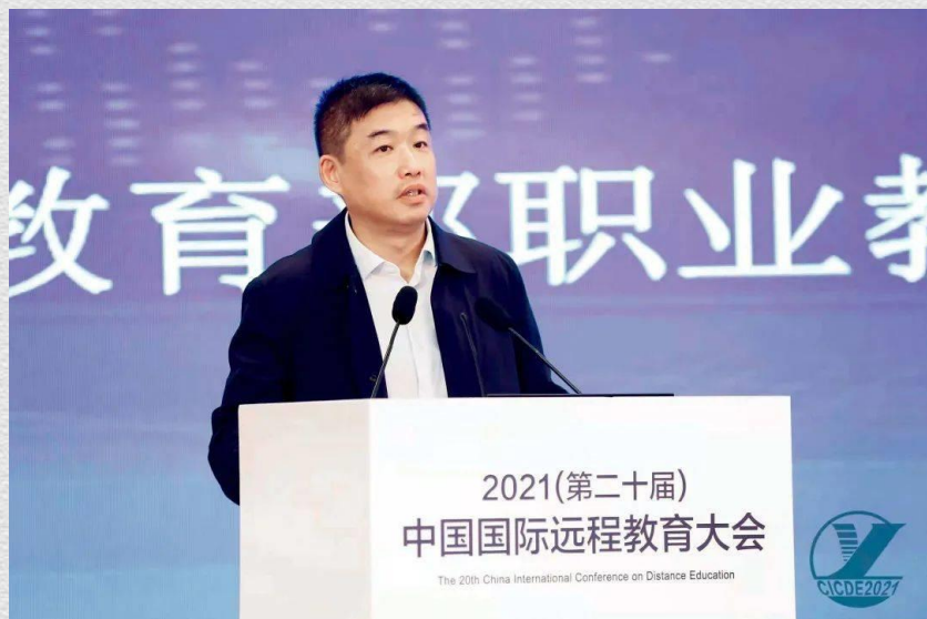
教育部职业教育与成人教育司副司长林宇

2021年11月11日，教育部办公厅印发了《普通高等学校举办非学历教育管理规定（试行）》，这份文件是自1990年以来，教育部在高校非学历教育领域出台的首份规范性文件，也是落实中央领导同志重要指示批示和中央巡视整改任务的重要举措，对推进全面从严治党、强化高校办学治校主体责任具有重要意义。文件印发后，各级各类媒体广泛进行报道，在社会上产生了积极正面反响，各省各高校也在深入学习文件精神。为进一步做好文件解读、回应各方关切、统一思想认识、抓好规定执行，《中国远程教育》杂志社组织了线上研讨，很及时也很有必要。下面，就文件起草的有关背景、总体要求和下一步工作考虑讲几点意见。