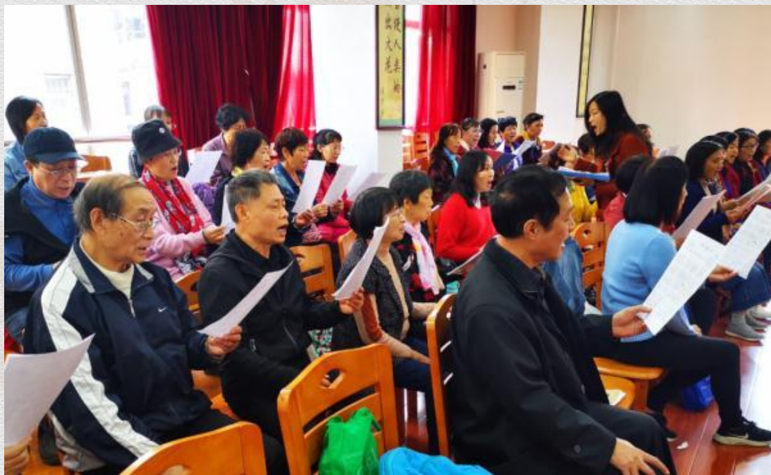
江门市老干部大学的学员在练习合唱 田建川

半月谈记者采访发现，不求毕业的“上大学”背后，折射的是老年人对充实精神生活的强烈需求。其一，出生于上世纪五六十年代的这代人，成长过程中缺乏接受良好教育的机会，“回炉再造”也是在弥补缺憾。其二，随着经济社会的快速发展，数字化无处不在，很多老人不会手机支付，不会扫健康码，看不懂导航，生活面临诸多不便，他们希望通过学习追赶社会步伐，不要被甩得太远。