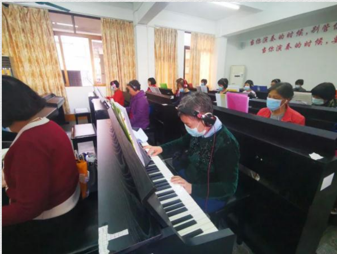
江门新会区老干部大学的学员在上钢琴课 田建川

“老年大学具有很强的公益性，不能靠收学费赚钱，实际上每学期每人也就一两百块钱。那场地、办公、硬件、师资的费用从哪里来？”广东一地级市开放大学负责人说，师资直接影响教学水平高低，现在一节课能开出的课酬仅100多元。由于课酬低，授课教师很难请，水平高的更不愿意来。