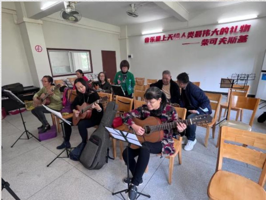
江门新会区老干部大学学员在练习吉他 胡拿云

“我们操劳了一辈子，为了家庭和儿女付出了很多，如今岁数大了希望能做点自己感兴趣的事。”61岁的张阿姨说，中国社会传统是“男主外女主内”，如今退休了，老伴喜欢宅家带娃，她却更喜欢上老年大学，到各地旅游，和新认识的姐妹们一起“放飞自我”。