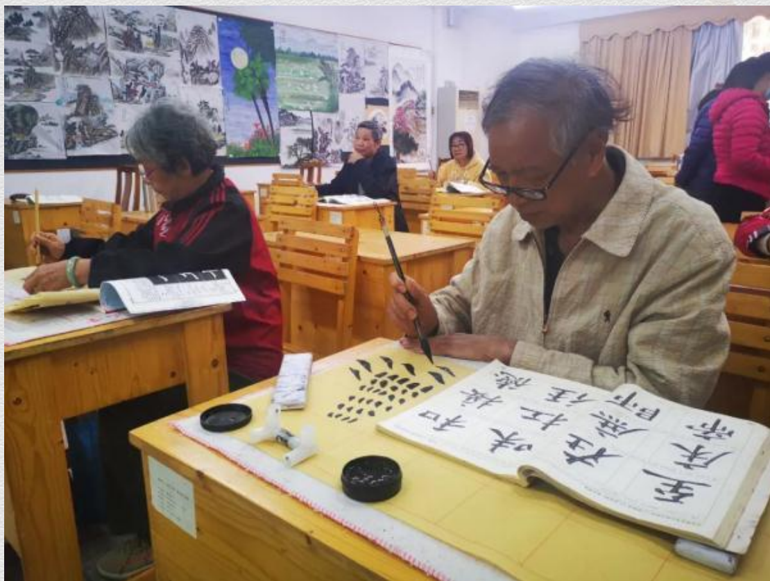
江门新会区老干部大学的学员在上书法课 田建川

明确主体，分清权责。同时，统筹加快推进老年教育和终身教育的立法进程，让老年教育工作有标准、有考核、有监督。